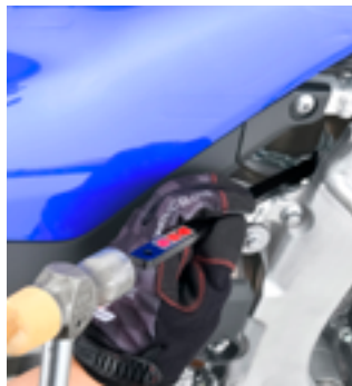
▲車体からリヤショックを取外すことなく作業が可能。