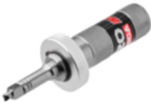
▲先端にマイナスドライバーを配置。これにより、低速側 COMP アジャスターも調整可能。